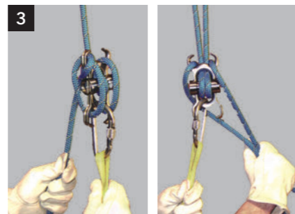
簡単に固定できます