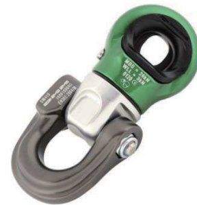
DMM SWIVEL FOCUS D スイベル フォーカス D