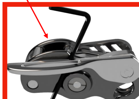
ロープエンドホール

六角レンチがロープ末端部を通す穴(ロープエンドホール)の中央部を超えてしまう場合は直ちに使用を中止してください。