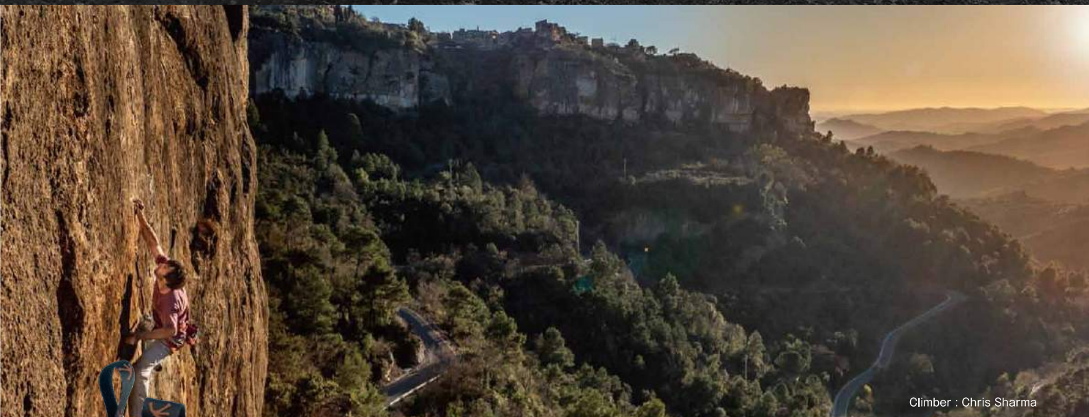
Climber : Chris Sharma