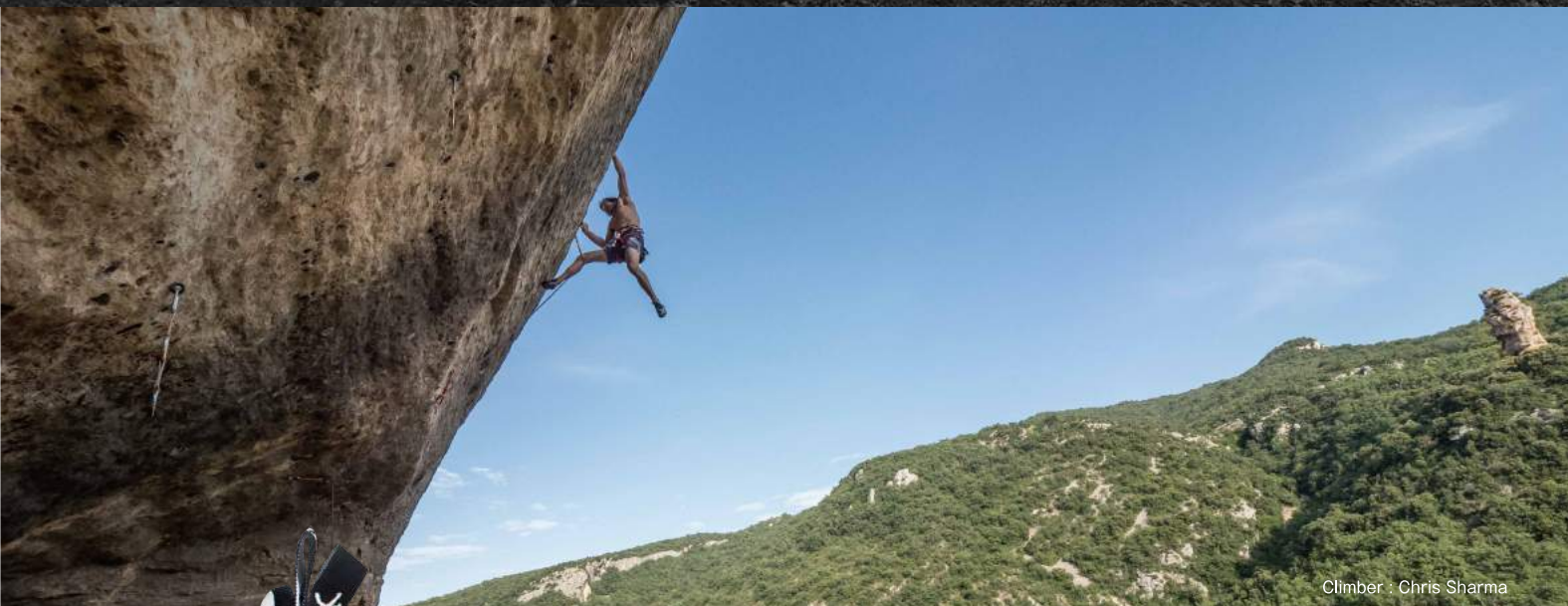
Climber : Chris Sharma