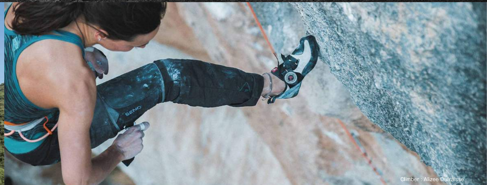
Climber : Alizee Dufraisse