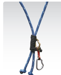
ブルージック&クイックドロ ¥5,000 (税込¥5,500) ANN065