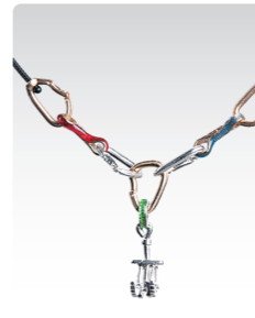
クイックドロ&カム ¥5,000 (税込¥5,500) ANN060