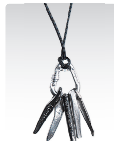
ハーケン&カラビナ ¥4,900 (税込¥5,390) ANN041