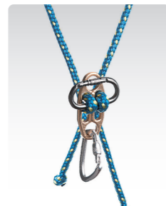
セット・ダブルロープ ¥4,600 (税込¥5,060) ANN056