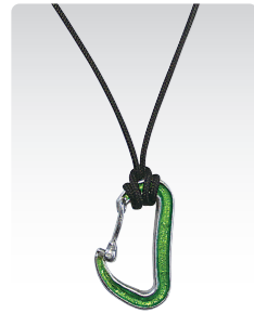
カラビナ ¥3,400 (税込¥3,740) ANN077