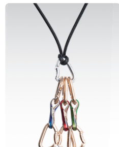
クイックドロ・カラー ¥4,600 (税込¥5,060) ANN024C