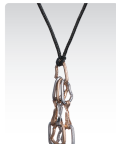
クイックドロ ¥4,600 (税込¥5,060) ANN024