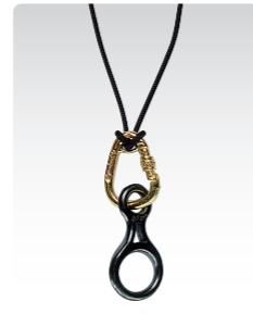
カラビナ&エイト環 [ゴールド] ¥3,600 (税込¥3,960) ANN038GD