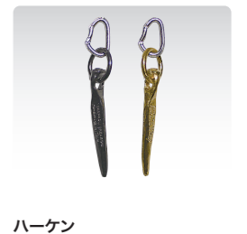
ハーケン ¥4,000 (税込¥4,400) ANP076