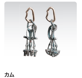
カム ¥6,300 (税込¥6,930) ANP011