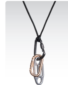
セット・ディッセンダー ¥3,600 (税込¥3,960) ANN055