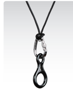
カラビナ&エイト環 [シルバー] ¥3,600 (税込¥3,960) ANN038SV