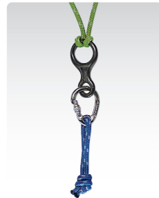
エイト環&カラビナ ¥4,600 (税込¥5,060) ANN038C