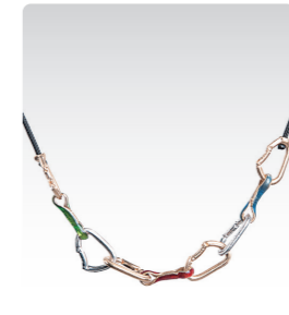
クイックドロ&エクスプレス ¥5,000 (税込¥5,500) ANN061