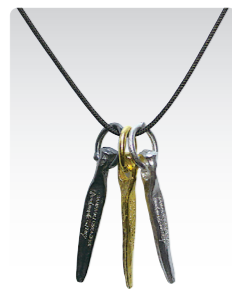
ハーケン ¥3,800 (税込¥4,180) ANN076