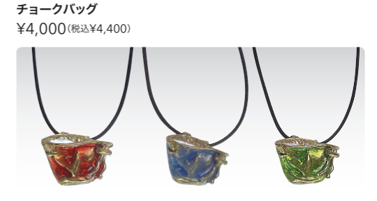
チョークバッグ ¥4,000 (税込¥4,400)