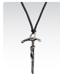
アイスクラス ¥3,600 (税込¥3,960) ANN028