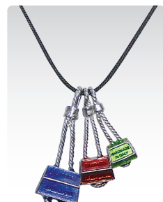
トルクナッツ ¥4,600 (税込¥5,060) ANN075