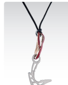
アイスアンカー・レッド ¥3,400 (税込¥3,740) ANN057