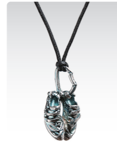
クライミングシューズ ¥3,200 (税込¥3,520) ANN020