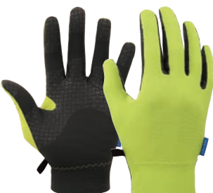
シトロングリーン