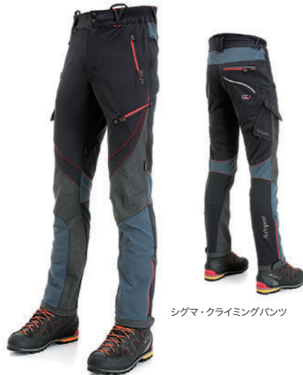
シグマ・クライミングパンツ