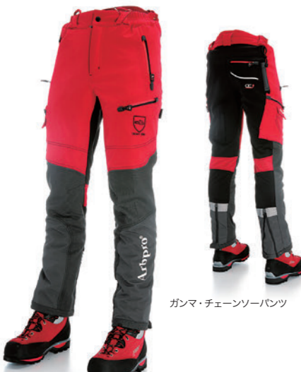
ガンマ・チェーンソーパンツ

※上記サイズは、あくまでもご購入の際の目安としていただき、実際に履いてご確認ください。