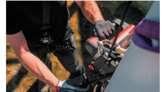
双方方向のスロットルを操作するだけで登行/下降の操作ができます。