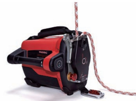
スピーディーなロープセットが可能なロープグラブシステム