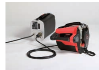
例：ACX+パワーサプライ