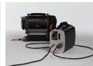
例：ACCII+パワーサプライ