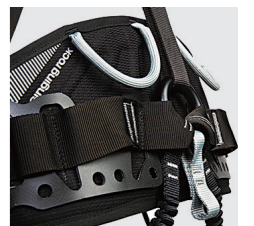
様々なアタッチメントが可能な3Dウエスト