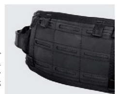
ウエストベルト、レッグループ、右ショルダーストラップにモールアタッチメントシステム対応ループ付き