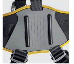
狭い箇所での摩擦を抑えるプラスチック製バックカバー