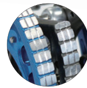
トリプルグリップカム