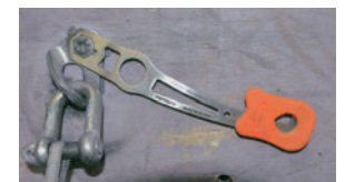
ナッツバスターによるボルト締め

ステンレス鋼からレーザーカットされたナッツ回収器。緩いボルトを締め付けるためのスパナを装備。ラバーは取り外しが可能でボルト締め付けの際のカバーにもなります。